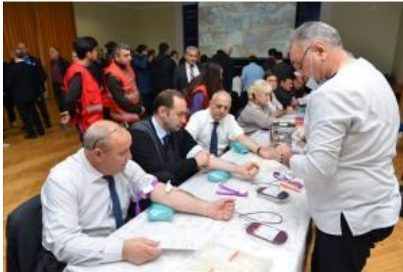
Sağlamlıq və qayğı