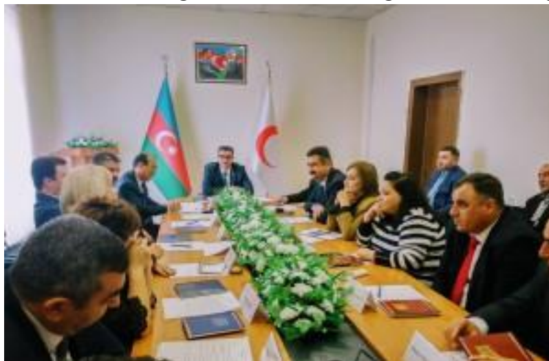
Regional Mərkəz və yerli bölmələrlə iş

İstər yerli, istərsə də beynəlxalq səviyyədə hər bir atılan xeyirxah addım əvəz olunmazdır. Azərbaycan Qızıl Aypara Cəmiyyəti növbəti illərdə də öz mandat və missiyasına uyğun olaraq, gücünü səfərbər edərək humanitar fəaliyyətini davam etdirməyə hazırdır. Yaxın gələcəkdə fondların artırılması istiqamətdə fəaliyyətlərimizi genişləndirməklə həm yerli həm də beynəlxalq səviyyədə Beynəlxalq Qızıl Xaç və Qızıl Aypara Cəmiyyətləri Federasiyasının çağırışlarına cavab verməklə humanitar layihələrimizin sayını yüksəltmək tərəfimizdən hədəflənmişdir. Qeyd edilən fəaliyyətləri gücləndirmək və yardımlarımızın sayını və əhatə dairəsini genişləndirmək əzmindəyik. Bu xeyirxah missiyamızı həyata keçirməkdə bizə yardımcı və köməkçi olan hər kəsə minnətdarlığımızı bildirir, onlara uğurlar və müvəffəqiyyətlər arzulayıram.